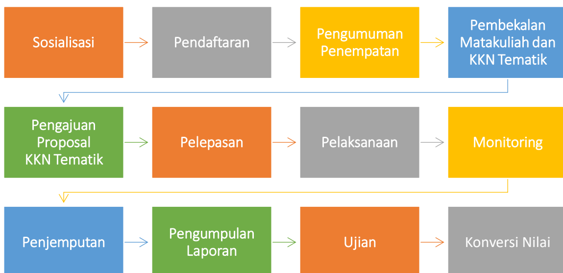
Gambar 2. Alur Pelaksanaan KKN TEMATIK

Alur pelaksanaan KKN TEMATIK disajikan pada Gambar 2 berikut.